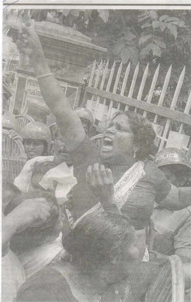
കേരള സർക്കാർ അധികാരത്തിലേയ്ക്കു കേരളസഭയിൽ, മാഷിമർ അഭിയാൻ നാഷണൽ ഹെൽത്ത് സർവ്വീസ് കേന്ദ്രം എന്നിവയുടെ മേൽ ആക്രമണങ്ങൾ നടന്നിരുന്നതിനെ തുടർച്ചയായി നടത്തിയ പ്രതിഷേധമായിരുന്നു ഇത്.