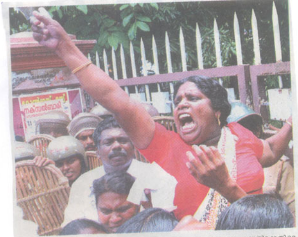
സാഗര ഗർഭജ്ജനനം: കേന്ദ്ര സർക്കാരിന്റെ തീരദേശ പരിപാലന പദ്ധതിക്കെതിരെ സമരസമരസംഘടനകളിലായി ഹെഡ്ലൈന്റുകളും നാഷണൽ ഫിഷ് വർക്കേഴ്സ് ഫോറത്തിന്റെയും മനോരമയിൽ തൊഴിലാളികൾ ഏജീസ് ഓഫീസ് പടിഞ്ഞാറ് മാർച്ച് നടത്തിയപ്പോൾ