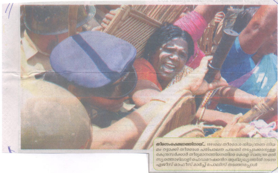
மீனவர்களின் மீன் உரிமைகளை காக்க பிரசார பயணம் - 1991ல் திருச்சூர் மீனவர்கள் சங்கம் அமைப்பதற்கான கருவிகளைப் பகிர்ந்து கொடுத்த போது.