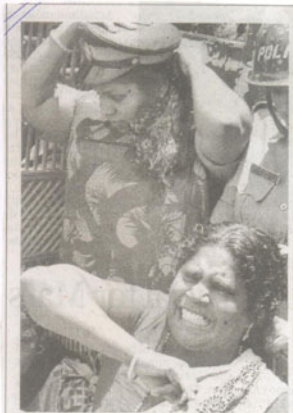
The AG's office march by the National Fish Workers Forum and Kerala Swathantra Matsya Thozhilali Federation in protest against the Centre's move to implement Coastal Conservation and Protection Programme, at Thiruvananthapuram on Saturday