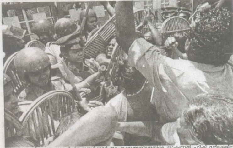
തീരദേശ പരിപാലന പദ്ധതി കേന്ദ്രസർക്കാർ നടപ്പാക്കുന്നതിനെതിരെ നാഷണൽ ഫിഷ് വർക്കേഴ്സ് ഫോറത്തിന്റെയും കേരള സ്വതന്ത്ര മത്സ്യത്തൊഴിലാളി ഫെഡറേഷന്റെയും നേതൃത്വത്തിൽ ഏജീസ് ഓഫീസിലേക്ക് നടത്തിയ മാർച്ച് പോലീസ് തടയുന്നു- ദീപിക