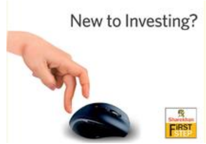
Open a demat account with Sharekhan & learn online trading. ShareKhan