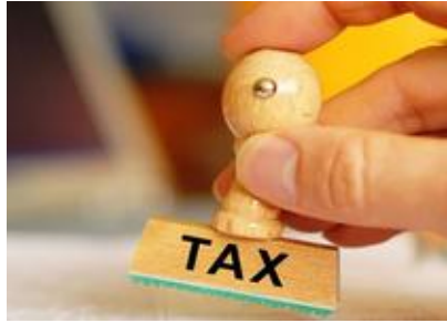
Investment that can save your tax MyUniverse