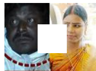
पुलिस के सामने से पति को