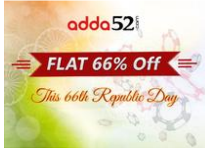
Get 66% off on adda52.com. Use code: TIMES1100 Adda52