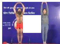
बाबा रामदेव संग शिल्पा शेट्टी