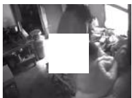
सास को बेरहमी से पीटते हुए