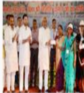
FATMA, JUNE 14 (UNI)-Bihar Chief Minister Nitish Kumar presenting cheque to the women members of Jeevika in Patna on Tuesday.